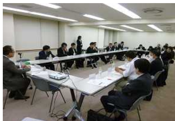
第3回(6/3)の研修会の様子