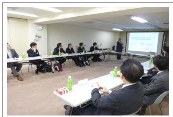
第2回(2/18)の研修会の様子